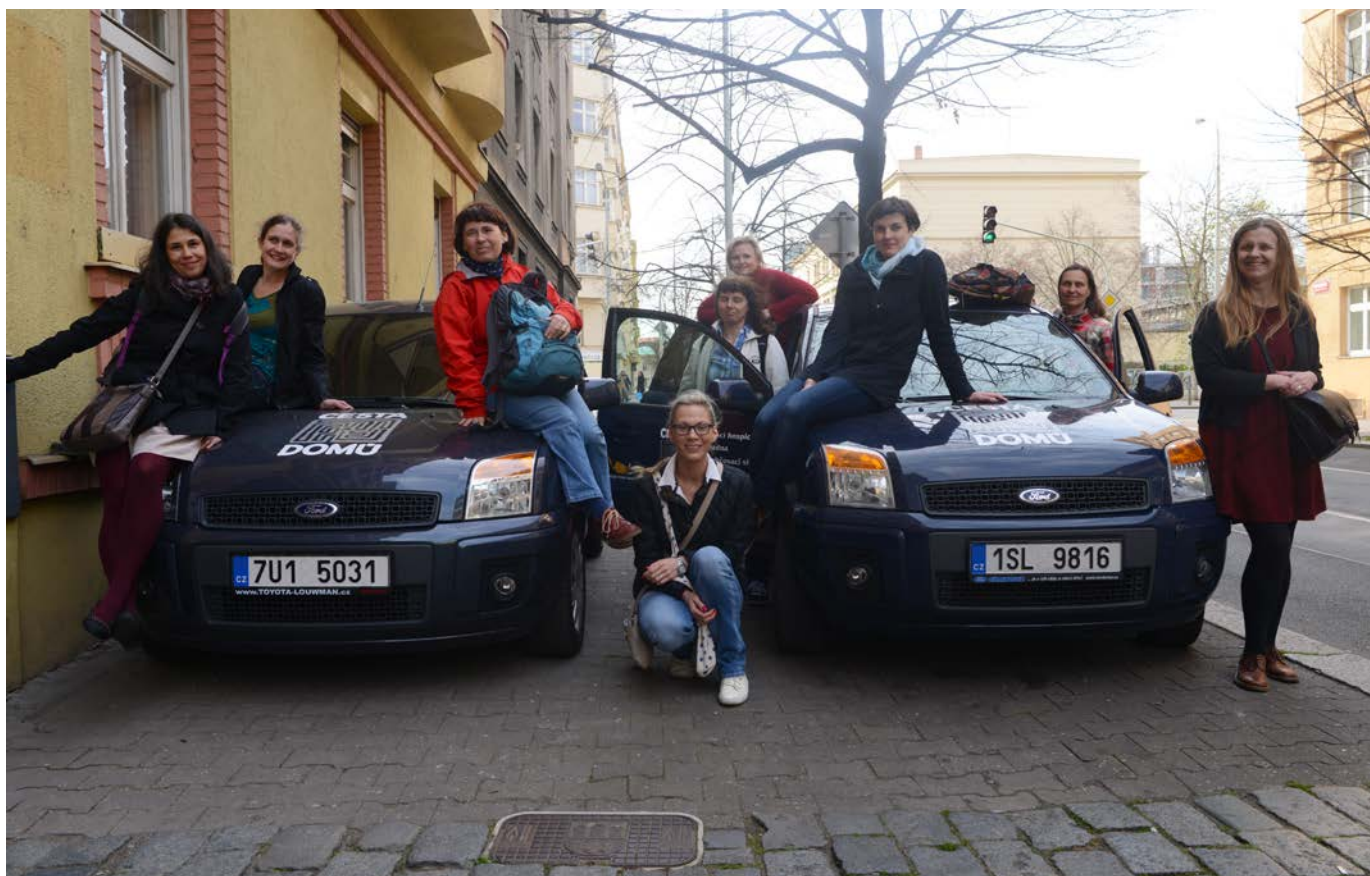
Zdravotní tým Cesty domů děkuje všem dárcům, kteří přispěli na koupi nových vozů.

veřejných osobností. Kampaň takového rozsahu v oblasti paliativní péče tu zatím nebyla: věnovalo se jí přes 30 článků ve všech významných médiích, v různých pořadech získala celkem 7 minut záběrů na televizní obrazovce na ČT, za rok 2014 navštívilo náš web 44 000 lidí a 1133 lidí si její pomocí formulovalo a sepsalo své preference týkající se závěru života. Na Facebooku sdílelo kampaň Mojesmrt.cz dohromady 3067 lidí, desetitisíce ji okomentovaly nebo jí daly "like". Kampaň byla také obsahem vyžádané přednášky na Česko-slovenské konferenci paliativní medicíny a získala druhé místo v soutěži Být vidět 2014 (kategorie nejlepší webový projekt). Jde o společný projekt Cesty domů, kreativní agentury YINACHI a grafického designéra Petra Kudláčka.