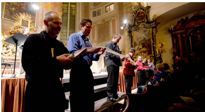
Staré písničky o životě a smrti si společně zazpívali na Dni hospiců jak muzikanti, tak posluchači.