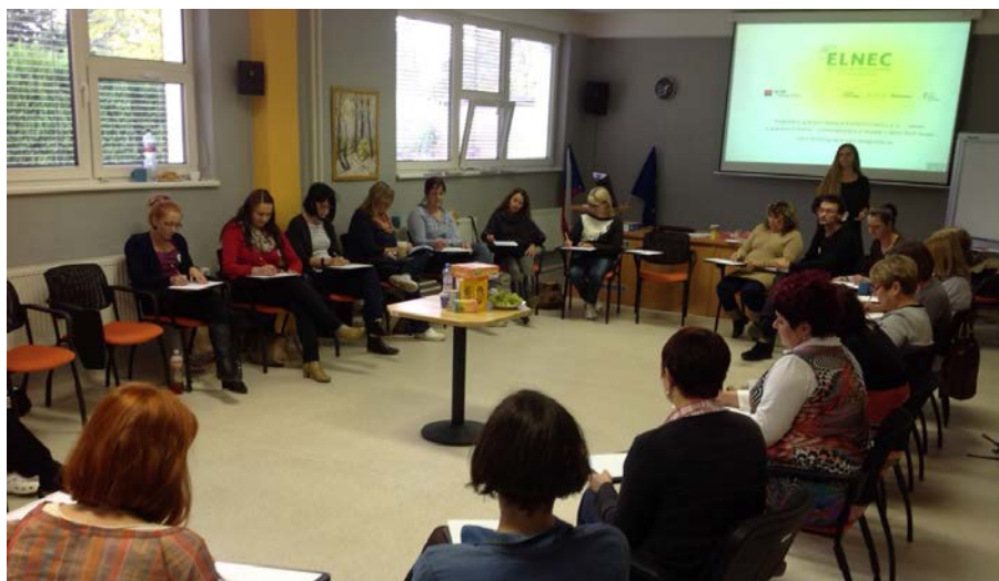
V loňském roce proběhlo více než 50 vzdělávacích akcí pro odbornou i laickou veřejnost lektorovaných zaměstnanci Cesty domů.

Zvyšování povědomí veřejnosti o možnostech péče a právech lidí na konci života (Program Fondu pro NNO prostřednictvím Nadace rozvoje občanské společnosti): Projekt byl zaměřený na zvýšení povědomí odborné i laické veřejnosti o tématu důstojného konce života a právech umírajících. Cíle projektu bylo dosaženo vzděláváním lékařů a zdravotnického personálu, vydáním a distribucí nových informačních materiálů, rozšířením služeb bezplatné poradny, podporou nových iniciativ v regionech a zapojováním představitelů místních samospráv do diskuse.