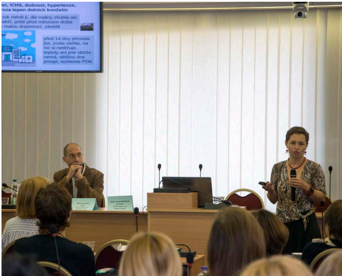
Cesta domů se věnuje vzdělávání odborníků v paliativní péči a podporuje všechny aktéry ze státní i nestátní sféry, kteří nabídku v této oblasti rozšiřují.

zprávě a výrok auditora se týkají pouze činnosti Cesty domů, z.ú. Účetní závěrka servisní organizace ProCestu s. r. o. je v plném znění k dispozici na www.cestadomu.cz .